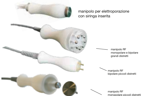
manipolo per elettroporazione con siringa inserita

Offrire soluzioni avanzate, APPARECCHIATURE PER L'ESTETICA MEDICALE non invasiva e mini-invasiva della miglior qualità e per ogni specifica esigenza di trattamento: questo è l'obiettivo che Medical Body Point, la divisione medica di Top Quality Group, persegue grazie alle grandi potenzialità tecniche e attraverso il costante investimento nella Ricerca & Sviluppo di nuove tecnologie quali VELVET SKIN TEC.